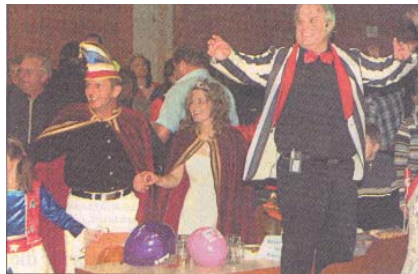
Die Würmer hielt es bei ihrer Prunksitzung nicht auf den Stühlen: Mit dabei beim ausgelassenen