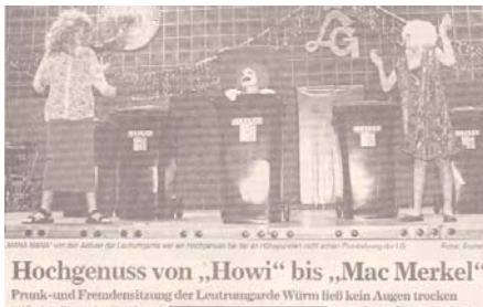
Hochgenuss von „Howi“ bis „Mac Merkel“ Prunk- und Fremdensitzung der Leutrumgarde Würm ließ kein Augen trocken

Bereits seit 1961 gehörte es zur Tradition des Spielmannszuges die Mitbürger am 1. Mai mit musikalischen Klängen zu wecken, was auch in der Vereinssatzung verankert wurde. Auch an den Stadtteilfesten war die LG immer federführend beteiligt.