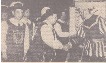
HISTORISCHE UNIFORMEN und die Bezeichnung „Leutrum-Garde“ nach dem größten Burgherrn der Liebeneck erblickt der vor „den Jahren gegründete Würmer Spielmannszug am Samstag beim nächsten Kreis-Treffen der Spielmannszüge. Bei der Standartenweihe stand der Goldstadt-Fanfarenzug Patz. Auf seinem Bild gestaltet ein Pforzheimer Kreis-Spielmannszug (rechts) den neu eingekleideten Würmer Spielmannszug.

Zwischenzeitlich spielten auch die ersten Mädchen im Spielmannszug mit. Mit der Eingliederung der Gemeinde Würm in die Stadt Pforzheim zum 01.09.1971, verbunden mit dem Übergang der Freiwilligen Feuerwehr in die Gesamtwehr der Stadt wurde aber dies mitunter zum Problem und führte -neben anderen Ursachen- zur freundschaftlichen Trennung zwischen Spielmannszug und Feuerwehr im Jahre 1972.